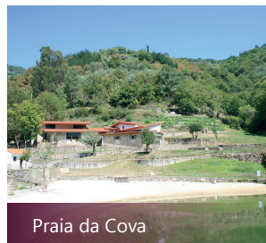
Praia da Cova