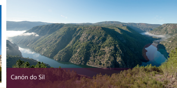
Canón do Sil