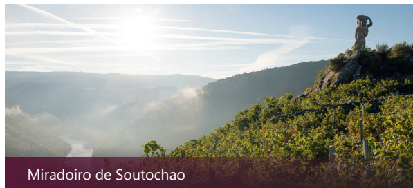
Miradoiro de Soutochao