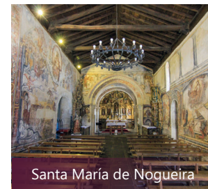
Santa María de Nogueira