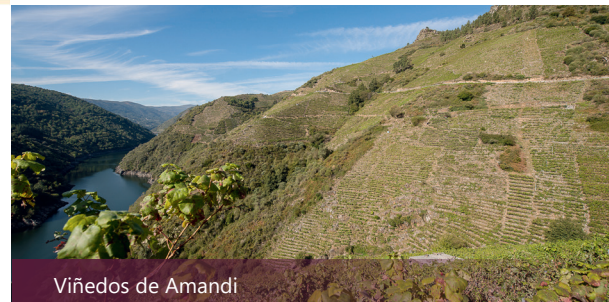
Viñedos de Amandi