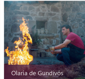
Olaría de Gundivós