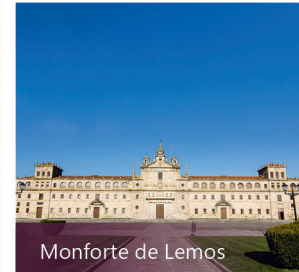
Monforte de Lemos