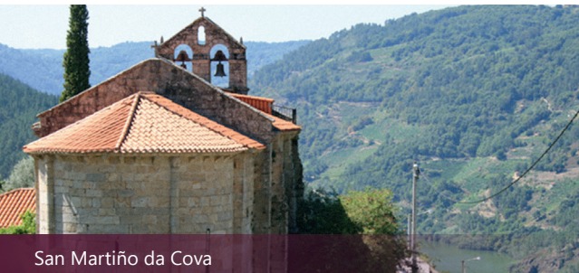
San Martiño da Cova

Lat. 42° 24' 35.7" N / Long. 7° 26' 36.9" O