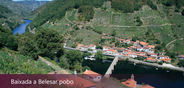
Baixada a Belesar pobo